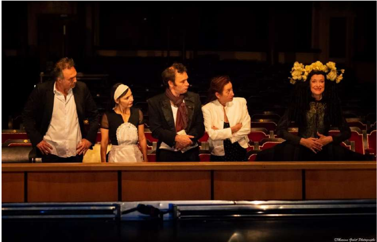
Italienne scène et orchestre de Jean-François Sivadier, 2003