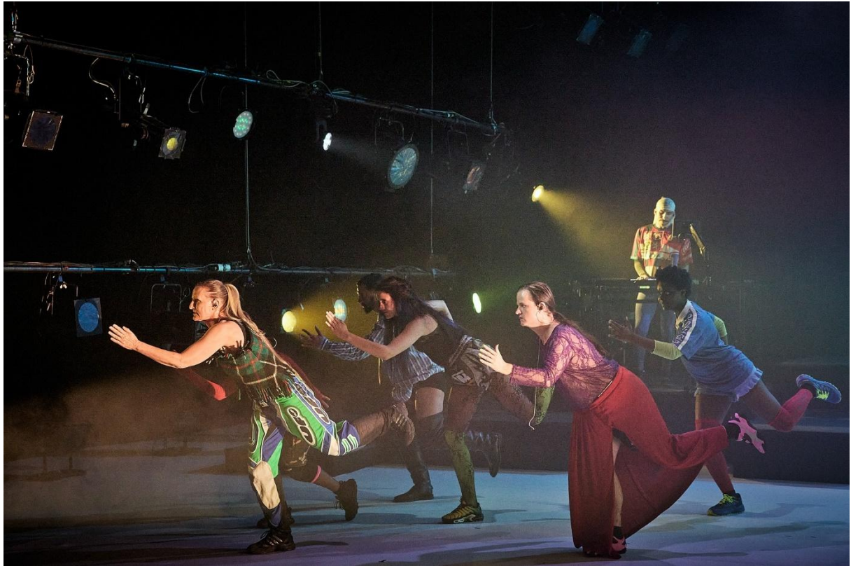
Nexus de l'adoration , conception Joris Lacoste