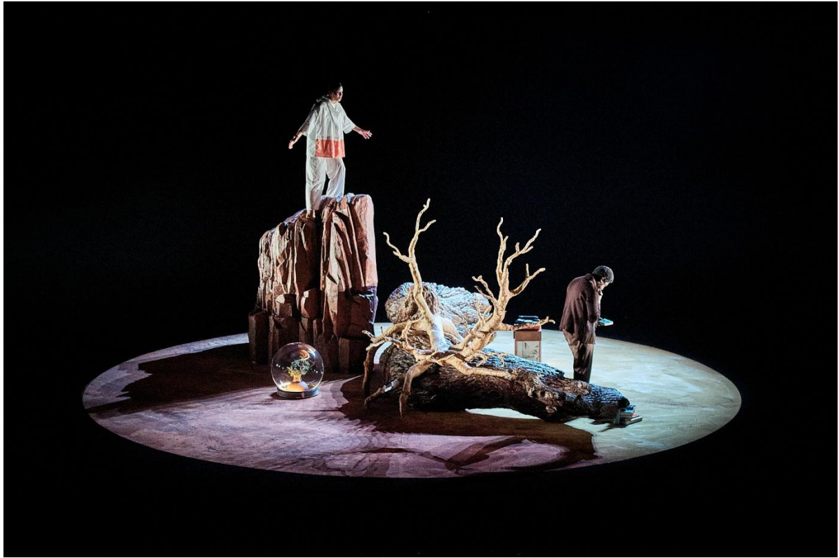
La Distance , Tiago Rodrigues, 2025