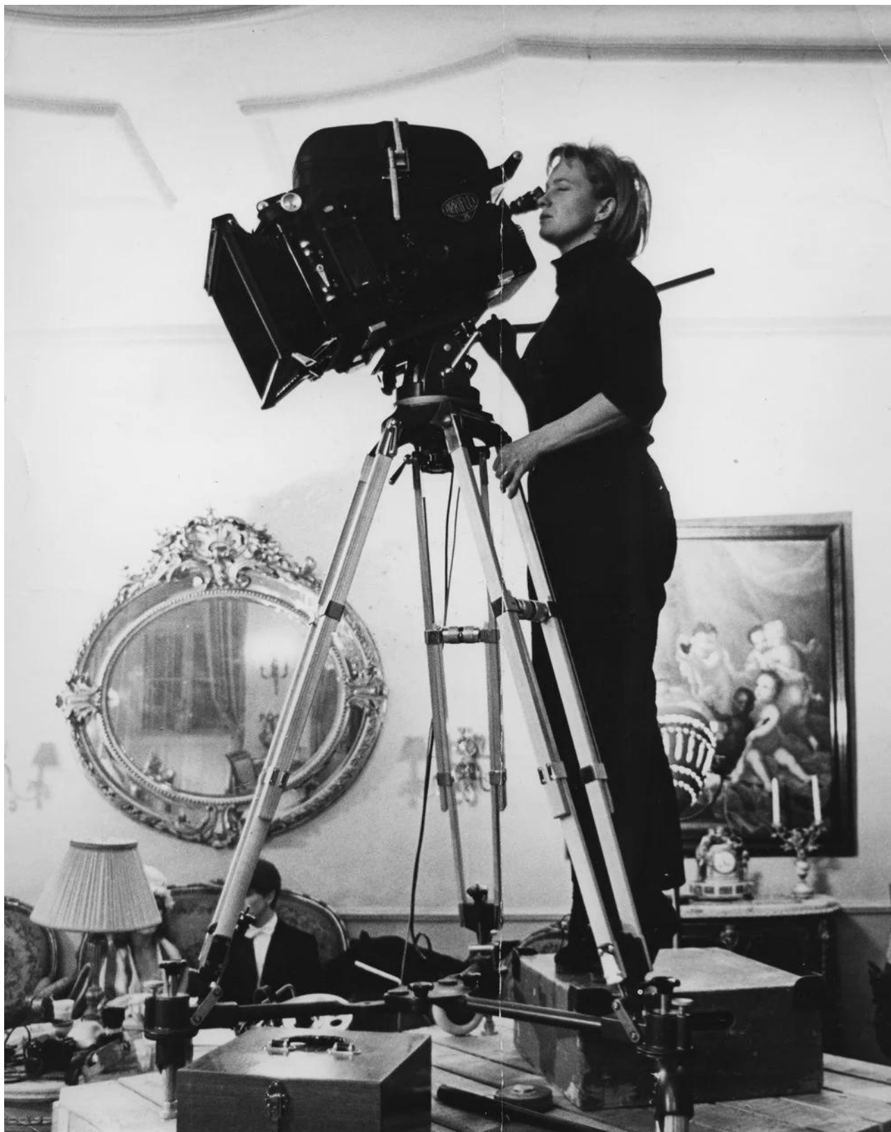
Mai Zetterling sur le tournage de Night Games (1966)