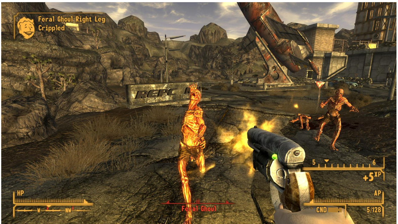
Fall Out : New Vegas (2010)