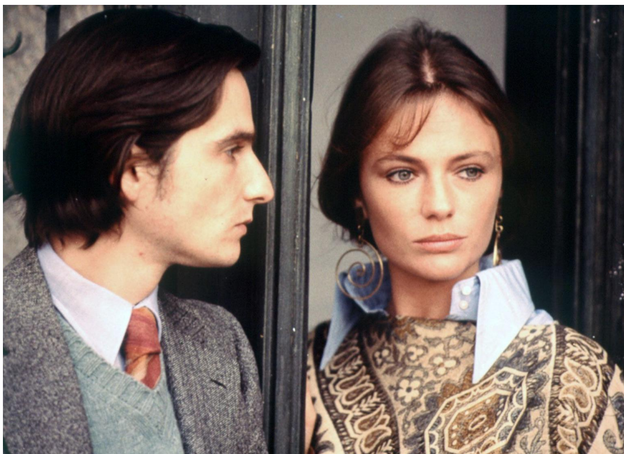
Jean-Pierre Léaud et Jacqueline Bisset dans La nuit américaine de François Truffaut (1974)